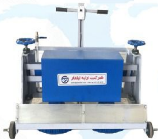
دو برس دیسکی