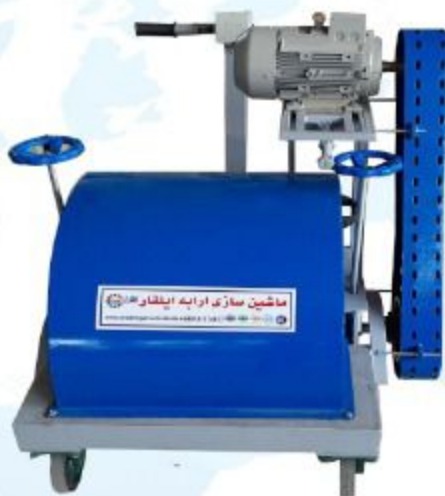
مدل برس شلاقی

و توانایی خاک گیری قالی های ظریف را دارا می باشد و فشار برس جارویی در این دستگاه قابل تنظیم می باشد.