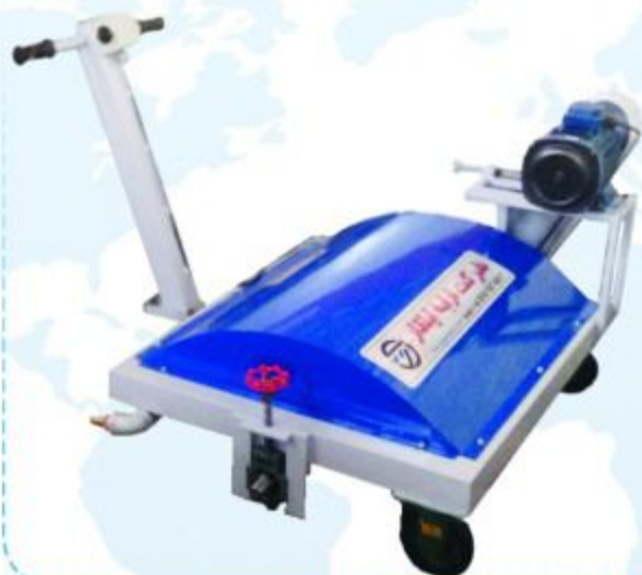
CC BRUSH WASH

این دستگاه مجهز به سیستم پاشش آب و برس خطی یا همان سیلندری میباشد. دستگاه با مشخصات ، سرعت بالا و انعطاف پذیر با حرکت آسان و شستشوی تمیز تر و کامل تر در خط تولید کارخانه ماشین سازی اربابه ایلقار تولید می گردد. این دستگاه قابلیت تنظیم فشار برس بر روی فرش را دارد.