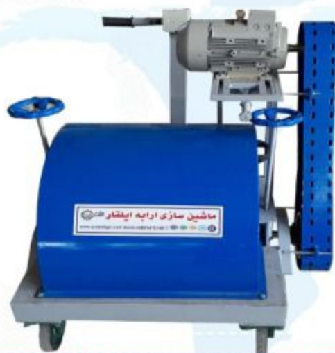
مدل برس شلاقی