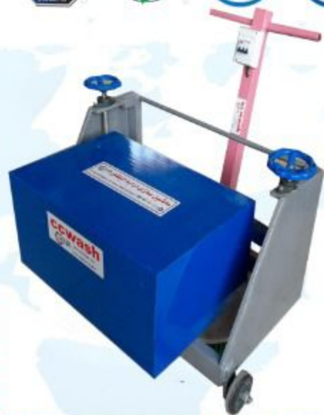
دو برس دیسکی

این دستگاه با دو برس دیسکی قادر به شستشوی کامل و تمیز فرش و موکت می باشد همچنین این دستگاه قادر است عملیات پاشش آب و مواد شوینده را با مصرف آب کمتر انجام دهد.