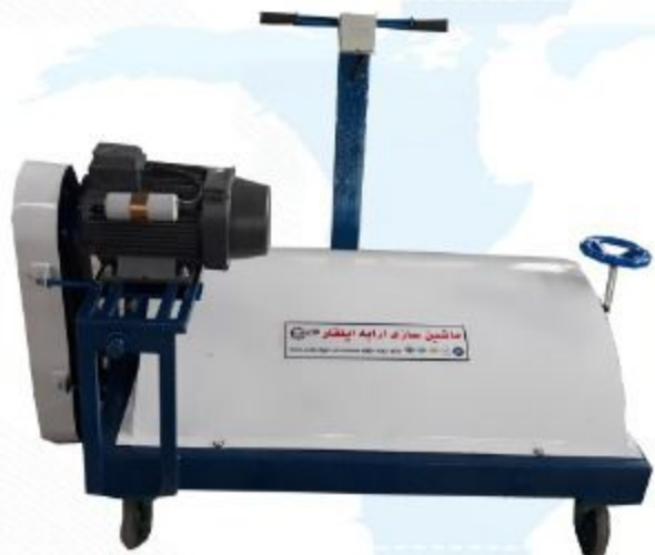
CC BRUSH WASH